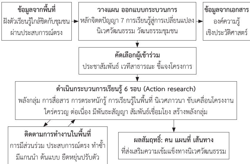
รูปที่ 1 กรอบแนวคิดต้นแบบของกระบวนการเรียนรู้เพื่อนำสู่การบ่มเพาะผู้ประกอบการทางนิเวศวัฒนธรรม

คณะผู้วิจัยอาศัยองค์ความรู้เชิงประวัติศาสตร์ของชุมชนบางปะกง ประสบการณ์ตรงจากการเคยลงสัมผัสเรียนรู้กับวิถีชีวิตในพื้นที่ รวมถึงแนวคิดด้านวัฒนธรรมชุมชน นิเวศวัฒนธรรม และการเรียนรู้สู่การเปลี่ยนแปลงแนวคิดปัญญาศึกษา (หลักจิตตปัญญา 7) มาเป็นแกนหลักในการออกแบบกระบวนการเรียนรู้ในภาพรวมเป็นเบื้องต้น รูปที่ 1 แสดงถึงกรอบแนวคิดต้นแบบในการจัดกระบวนการเรียนรู้เพื่อนำไปสู่ผลสัมฤทธิ์ของการบ่มเพาะคนและสร้างผลผลิตที่ส่งเสริมความเข้มแข็งทางนิเวศวัฒนธรรม จากนั้นเมื่อจะเริ่มดำเนินงานวิจัยในแต่ละรอบ คณะผู้วิจัยทำการประชุมหารือ และออกแบบเนื้อหาของกระบวนการในรายละเอียด รวมถึงเครื่องมือและวิธีการที่จะใช้สำหรับแต่ละกิจกรรม หนึ่งในการทำงานในรอบถัด ๆ ไป จะอาศัยผลของการวิเคราะห์และประเมินกระบวนการ ซึ่งเป็นสิ่งใหม่ ๆ ที่ได้เรียนรู้จากการทำงานแต่ละรอบมาใช้เป็นข้อมูลร่วมในการออกแบบวางแผน รวมถึงการปรับปรุงเปลี่ยนแปลงรายละเอียดของกระบวนการเรียนรู้ด้วย