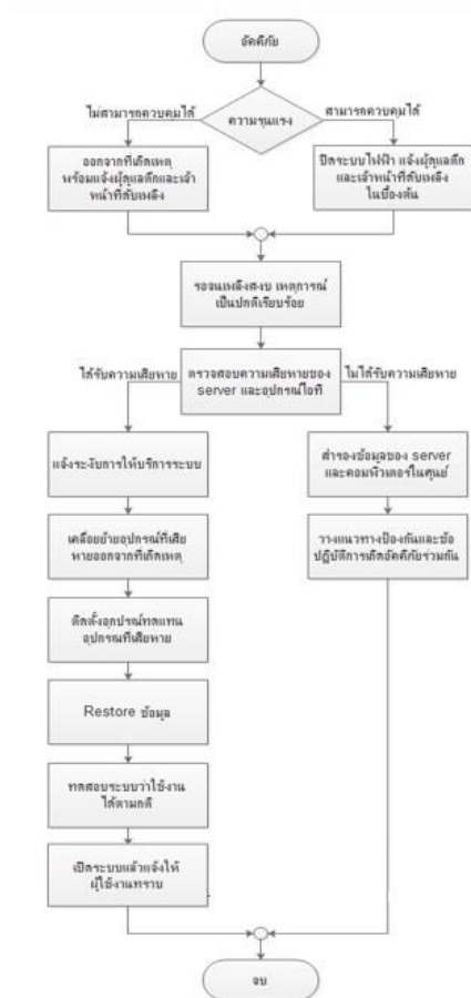
ภาพ โพรชาตการปฏิบัติเมื่อเกิดเหตุอัคคีภัย

แผนการปฏิบัติเมื่อเกิดเหตุอัคคีภัย ศูนย์ได้จัดทำโพรชาตเพื่อแสดงวิธีการปฏิบัติที่ถูกต้องในการรับมือกับเหตุการณ์อัคคีภัย เมื่อเกิดเหตุอัคคีภัยขึ้นให้เจ้าหน้าที่ประเมินสถานการณ์ว่าสามารถควบคุมเพลิงได้หรือไม่ หากควบคุมเพลิงได้ให้รีบปิดระบบไฟฟ้าและแจ้งผู้ดูแลตึก เจ้าหน้าที่ดับเพลิงในทันที แต่หากไม่สามารถควบคุมเพลิงได้ให้รีบออกจากที่เกิดเหตุพร้อมแจ้งผู้ดูแลตึกและเจ้าหน้าที่ดับเพลิง จากนั้นรอรจนเพลิงสงบเหตุการณ์เป็นปกติเรียบร้อยแล้วดำเนินการตรวจสอบความเสียหายของ Sever และอุปกรณ์ไอที หากพบว่าได้รับความเสียหายให้รีบดำเนินการแจ้งระงับการให้บริการระบบ เคลื่อนย้ายอุปกรณ์ที่เสียหายออกจากพื้นที่เกิดเหตุ ติดตั้งอุปกรณ์ทดแทน ทำการ Redtore ข้อมูล ทดสอบระบบให้ใช้งานได้ตามปกติ เปิดให้บริการและแจ้งให้ผู้ใช้งานทราบ แต่หากไม่ได้รับความเสียหายก็จะดำเนินการสำรองข้อมูลและวางแผนหาแนวทางป้องกันร่วมกันต่อไป